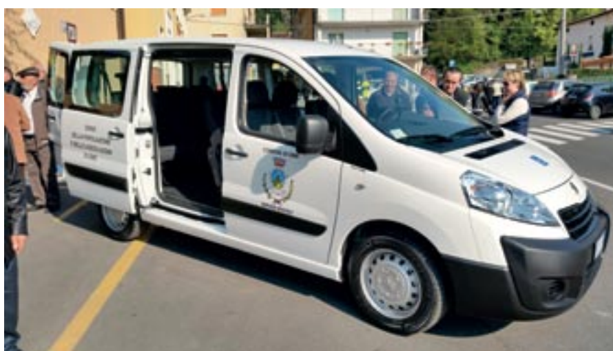
La nuova Peugeot per il trasporto dei disabili presentata alla comunità il 19 aprile 2015

mezzo ipotizzato, un pulmino Peugeot a 9 posti, ma anche sostenere alcuni costi di manutenzione degli altri mezzi adibiti ai servizi di trasporto disabili. Il nuovo automezzo, da tempo atteso per sostituirne altri oramai "spremuti" e per il vantaggio di poter trasportare alla medesima destinazione in un solo viaggio le stesse persone che prima richiedevano l'utilizzo di due autovetture, è stato consegnato nei primi giorni di aprile e presentato alla comunità in occasione dell'ingresso del nuovo parroco Don Lu-