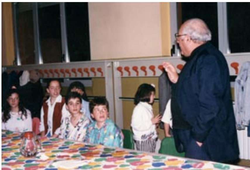
In compagnia di alcuni alunni

Nominato canonico onorario della Cattedrale (1976) si prestò generosamente anche per amministrare le Cresime e andava volentieri nelle parrocchie, manifestando stima per i sacerdoti in cura di anime, impegnando nel servizio pastorale