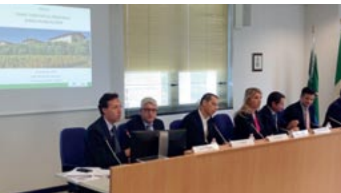
La presentazione del documento propedeutico presso gli uffici regionali dello STER a Brescia

Con la delibera di giunta n. 53 del 29/06/2015 , anche il comune di Ome, al pari degli altri 17 che hanno sottoscritto l'Accordo "Terra di Franciacorta", ha approvato il documento propedeutico alla realizzazione del Piano territoriale d'area della Franciacorta. Il lavoro di Terra della Franciacorta (sigla nata dall'accordo tra i 18 Comuni di zona per creare un modello di sviluppo sostenibile e unitario del territorio nel 2011) prosegue spedito e ha concluso con questo documento la prima fase, che è stata interamente