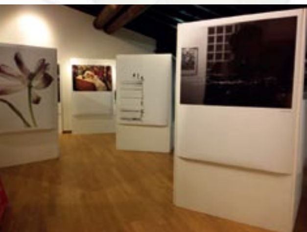
Uno scorcio della mostra fotografica " In ATTO Visivo "

12 luglio: evento Damascus Brixia 2015 , mostra del coltello artigianale.