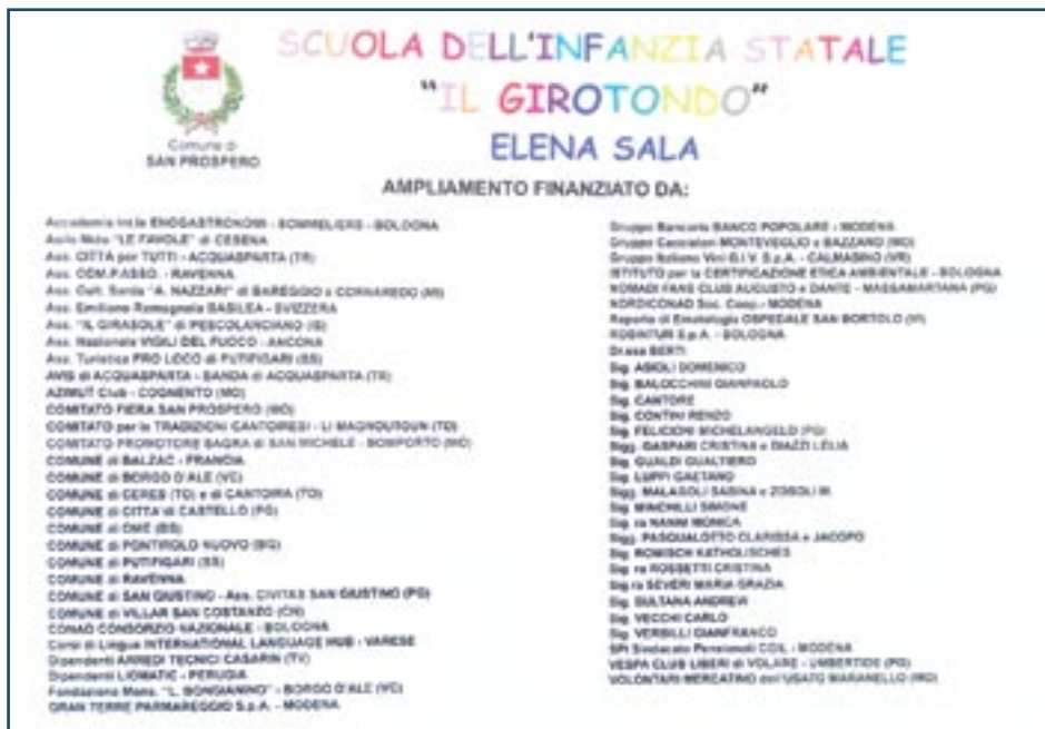
Foto della targa dei benefattori affissa nell'ala ristrutturata e ampliata

natalizie 2015, costata circa 3 milioni di euro, in gran parte finanziati da Regione e Stato.