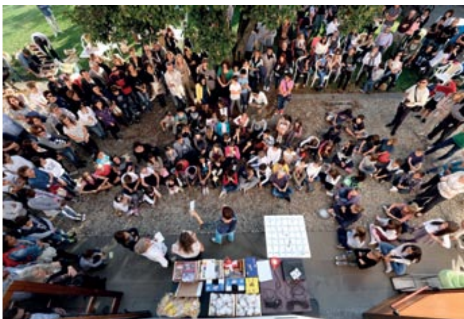
Un momento della premiazione dei partecipanti al concorso di disegno

Ci si proponeva principalmente di usare sorriso e divertimento per migliorare la socializzazione e superare alcuni stereotipi tra maschile e femminile. Ma non solo questi erano gli obiettivi: i bambini hanno dovuto attivare abilità di ascolto, autocontrollo, attenzione all'altro. Ci si doveva muovere come una sola cosa ed essere un vero gruppo! I risultati sono stati davvero soddisfacenti. Inoltre, per ringraziare i genitori che hanno finanziato il progetto, ed anche per metterli un po' alla prova con le "insidie" della danza, si è organizzato per loro una FESTA CONCLUSIVA! I bambini sono stati insegnanti, cavalieri e damigelle per il loro cari. Mamme, papà, nonni, fratelli, grandi e piccini... hanno ballato, riso, fatto amicizia... con grande disponibilità e allegria. La dimostrazione delle abilità dei piccoli allievi è continuata anche nell'ambito dei mercatini natalizi del 13 dicembre: qui gli alunni della Primaria hanno messo in vendita dei loro manufatti, con l'obiettivo di raccogliere fondi per le varie attività scolastiche.