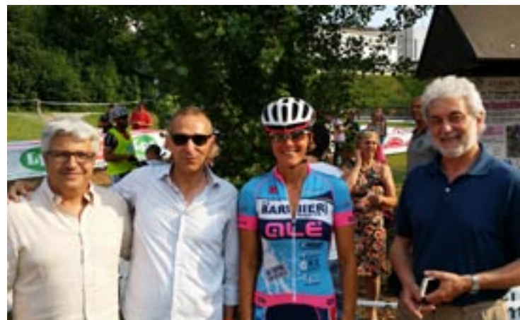
La campionessa olimpica Paola Pezzo al Parco delle Terme per la gara di MTB