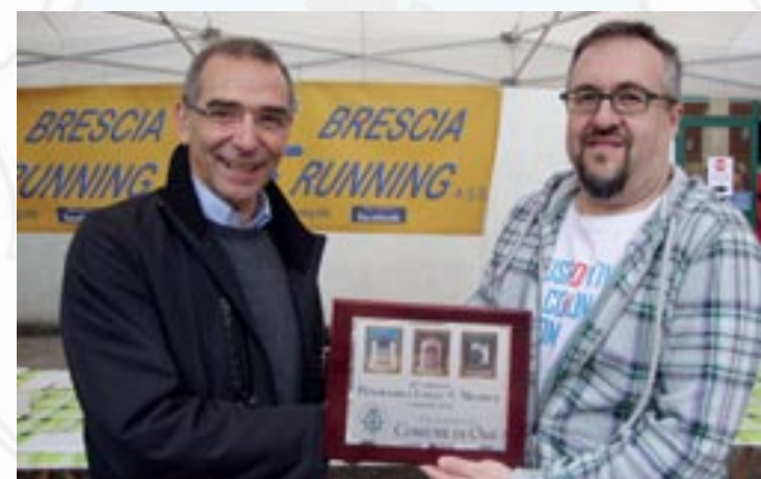
Due momenti delle premiazioni della "Panoramica del Primo Maggio"

Il Gruppo Escursionistico di Ome ha compiuto cinque anni di vita e conta ormai un centinaio di iscritti, sempre in crescita, a dimostrazione della validità delle molteplici iniziative che nel corso di questi anni sono state proposte. Per i membri del Direttivo e soci questo è motivo di grande soddisfazione e di stimolo per continuare questa bellissima avventura. Tantissimi sono i momenti vissuti insieme, i luoghi e i paesaggi di incontaminata bellezza che hanno lasciato in ogni partecipante gioie ed emozioni. E' con questo spirito che il Geo intende proseguire, cercando di coinvolgere un numero sempre maggiore di persone nelle escursioni in montagna, ma non solo, mantenendo sempre i piedi per terra!