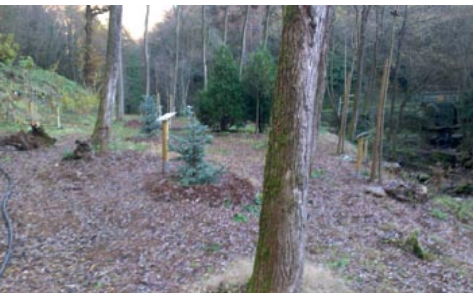
Il Giardino Americano al momento della piantumazione

cinque docce al giorno con la sola scusante che fa caldo!