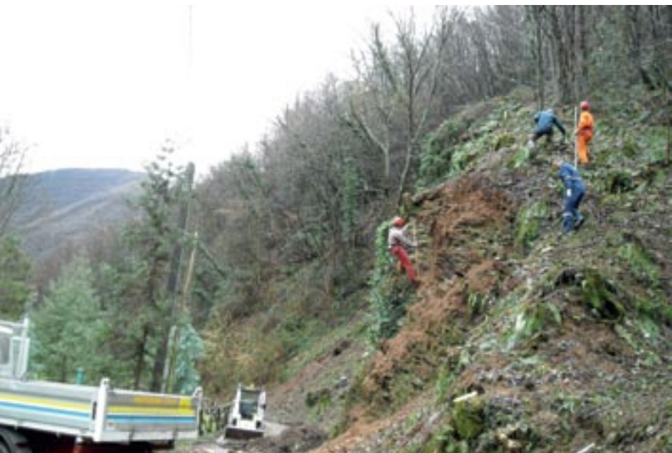
La Protezione Civile al lavoro per una frana presso la strada di Fus vicino all'Orto Botanico