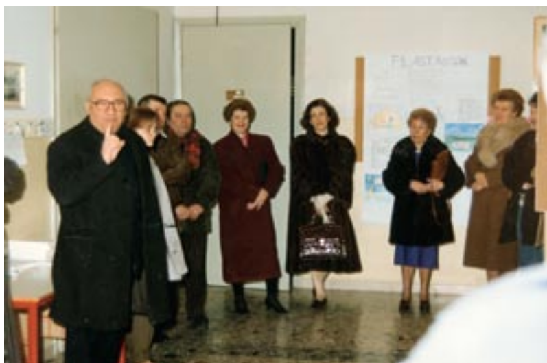
Il Preside con alcuni genitori e insegnanti della Scuola

Nel 1961 fu nominato assistente spirituale all'Università cattolica di Milano (1961-1970), dove si laureò in filosofia. Mons. Borboni donò all'ateneo fondato da padre Gemelli il secondo decennio del suo ministero: erano anni difficili, coi fermenti della contestazione. In quel periodo io lo vidi più volte in Seminario maggiore di Brescia, e si fermava volentieri con noi chierici raccontandoci quanto accadeva all'Università con un linguaggio fiorito e scherzoso e noi stavamo numerosi in crocchio attorno a lui a