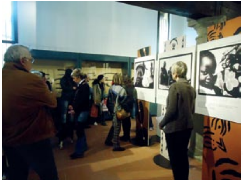
La mostra fotografica "Essere Donna in Burkina Faso"