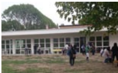
La nuova ala scolastica