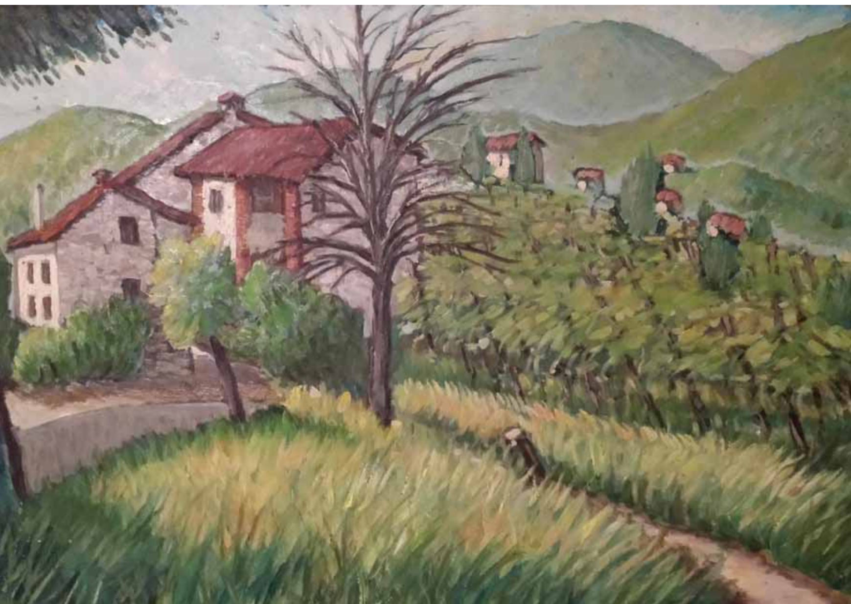
Opera di Nando Barili