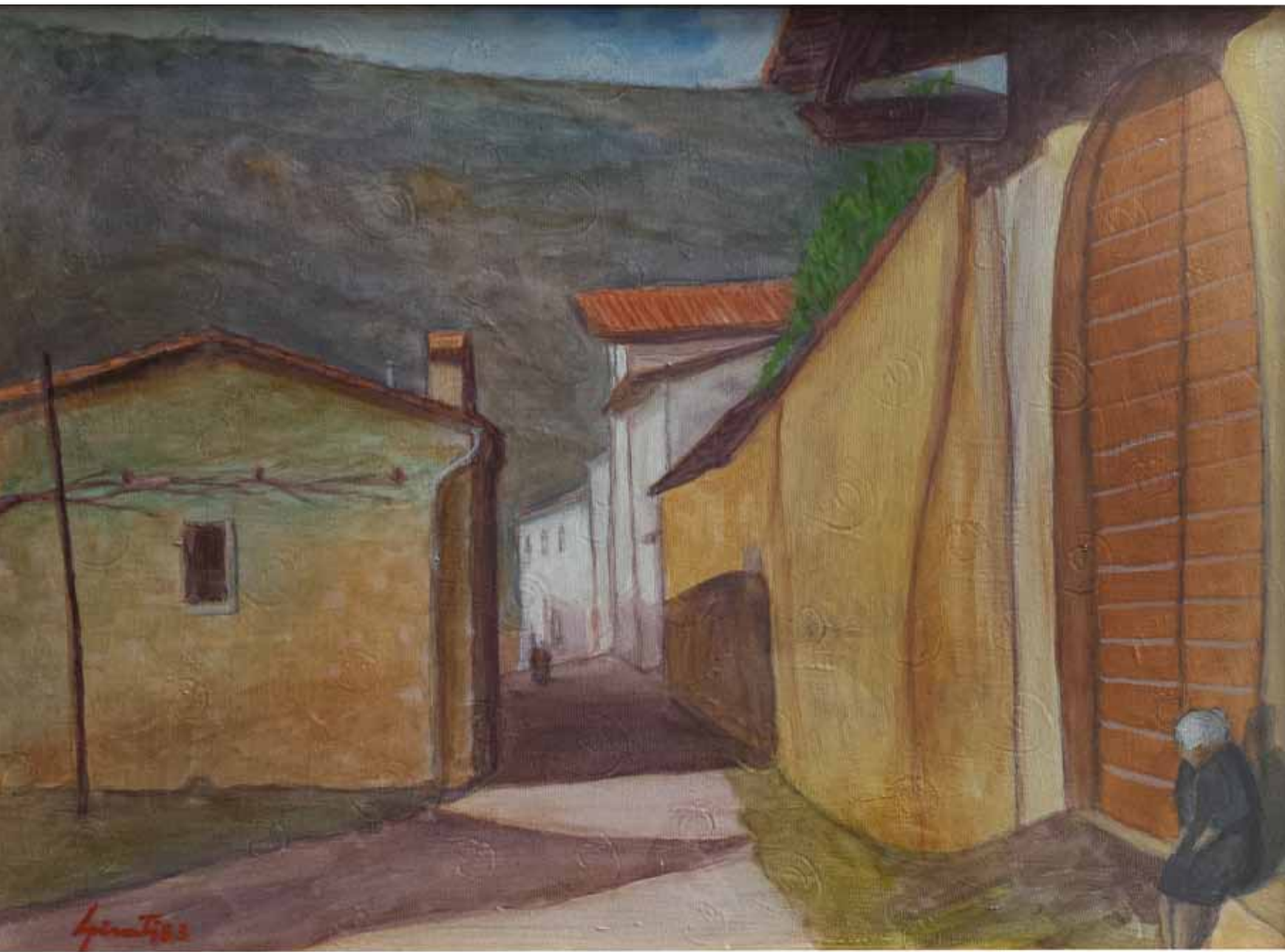
Opera di Franco Girati