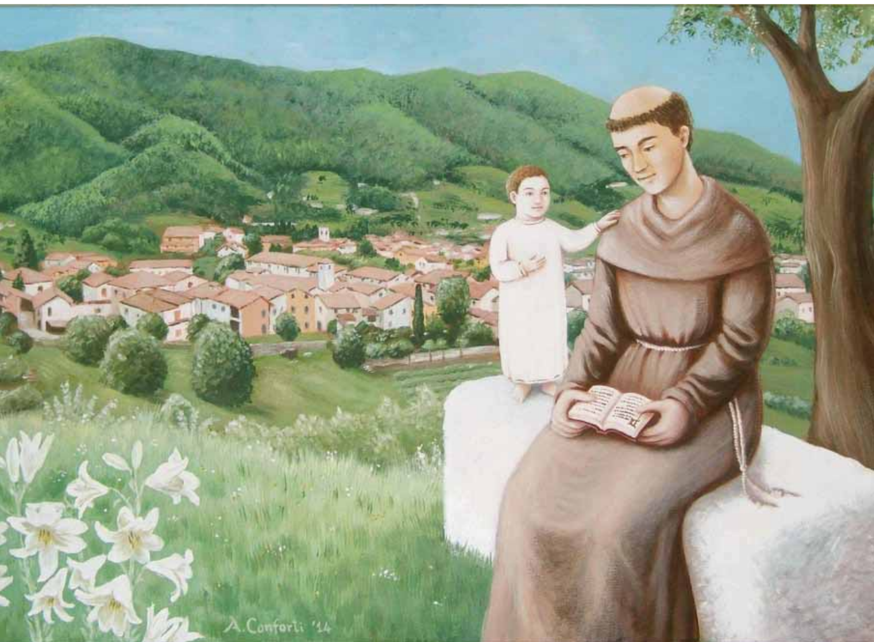
Opera di Anna Conforti