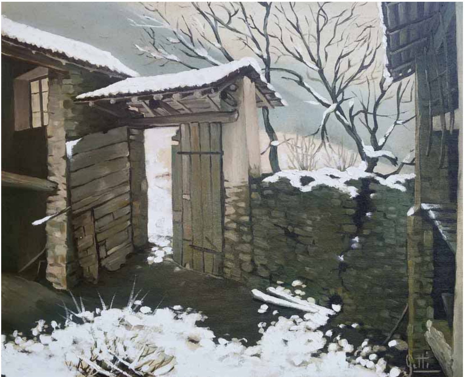
Opera di Fabio Gatti