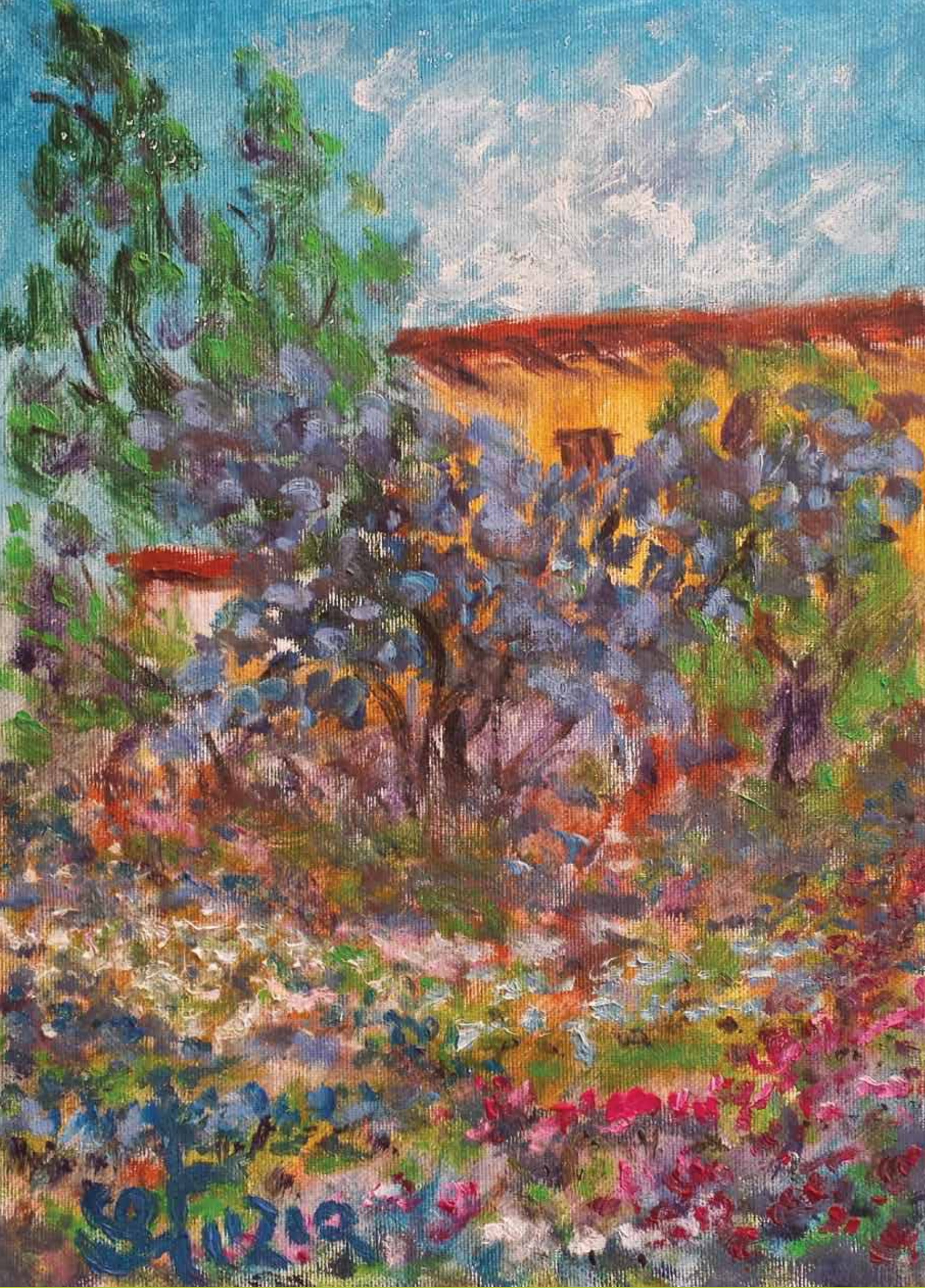
Opera di Luigi "Stuzia" Borboni